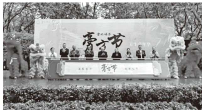
领导和嘉宾为开幕式剪彩